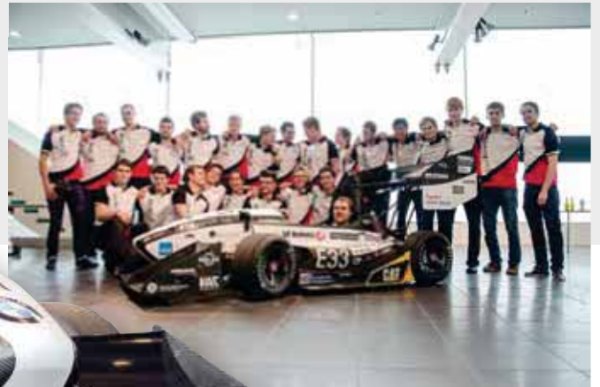
Rollout von «grimsel»