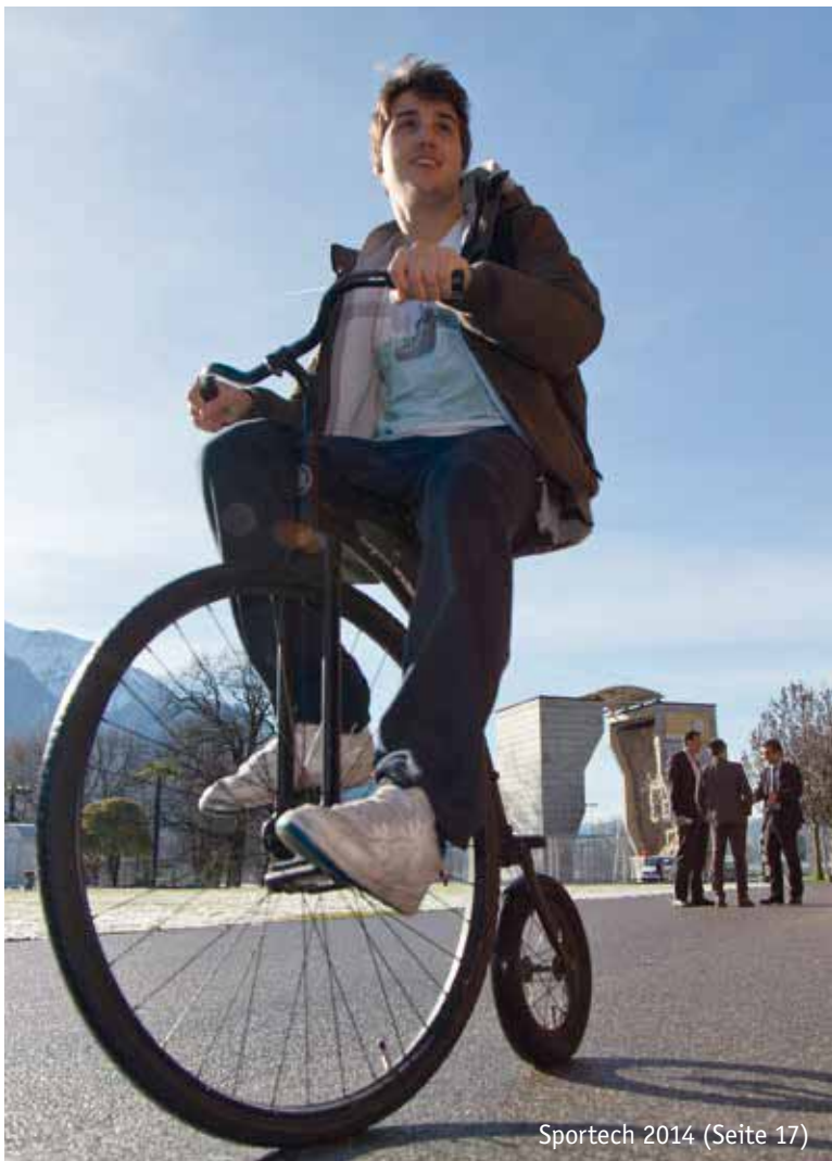
Sportech 2014 (Seite 17)