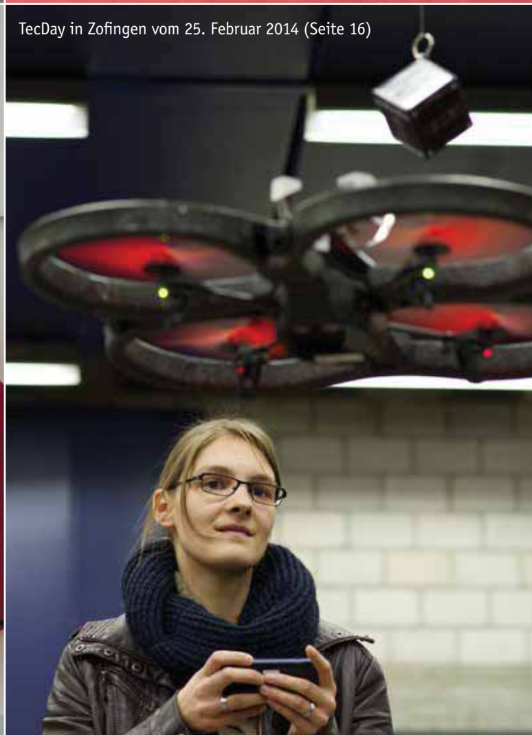
TecDay in Zofingen vom 25. Februar 2014 (Seite 16)