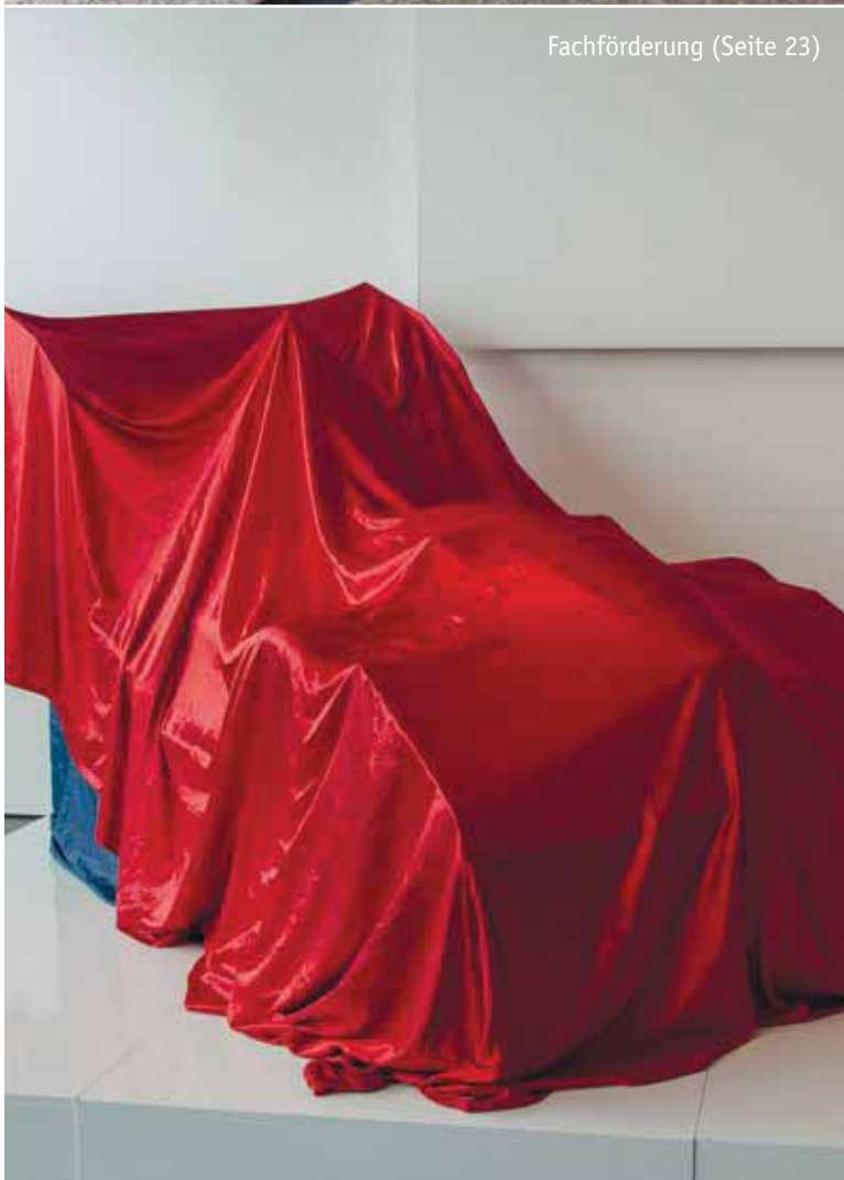
Fachförderung (Seite 23)