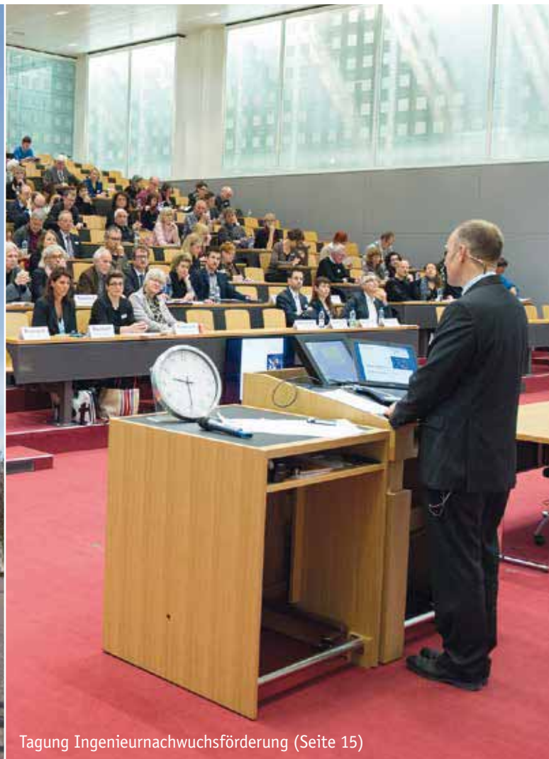
Tagung Ingenieurnachwuchsförderung (Seite 15)