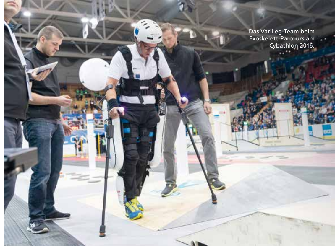
Das VariLeg-Team beim Exoskelett-Parcours am Cybathlon 2016.

Schon die Auswahl der Aufgaben zeigt, dass ein Knackpunkt dieser Hilfsmittel ihre Alltagstauglichkeit ist. Denn ausserhalb der kontrollierten Um-