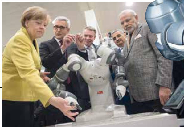
Der Industrieroboter Yumi begegnet der Deutschen Bundeskanzlerin Angela Merkel

Eine besondere Eigenschaft von Robotern ist, dass sie frei programmierbar und somit für unterschiedliche Aufgaben einsetzbar sind. Das unterscheidet sie von Automaten, die nur eine bestimmte Aufgabe erledigen können, z. B.