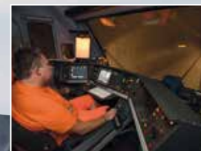
La tecnica più moderna: tutti i comandi di movimento sono trasmessi direttamente alla cabina del macchinista sulla locomotiva.