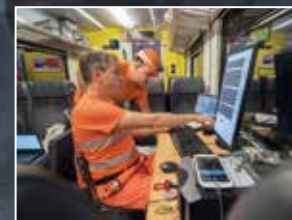
Il sistema radio della galleria deve funzionare: test con la carrozza misure radio delle FFS.