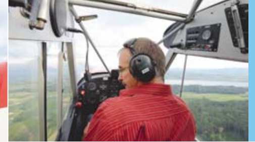
▲ «Speed checked, Altitude checked, Engine Instruments green»: il n'y a pas de meilleur endroit pour savourer la vue que d'en haut.